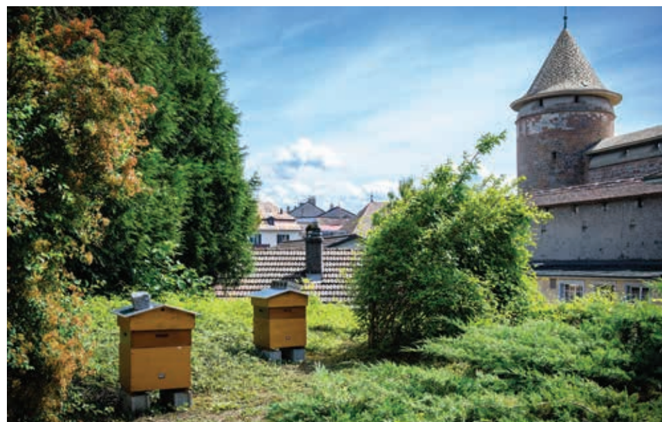
Ruches près du Parc de l'Indépendance

Au travers de sa politique de l'environnement, l'agglomération atteindra, à moyen terme, un aménagement d'espaces verts mieux adapté aux attentes de la population et à la préservation des milieux naturels (biodiversité).