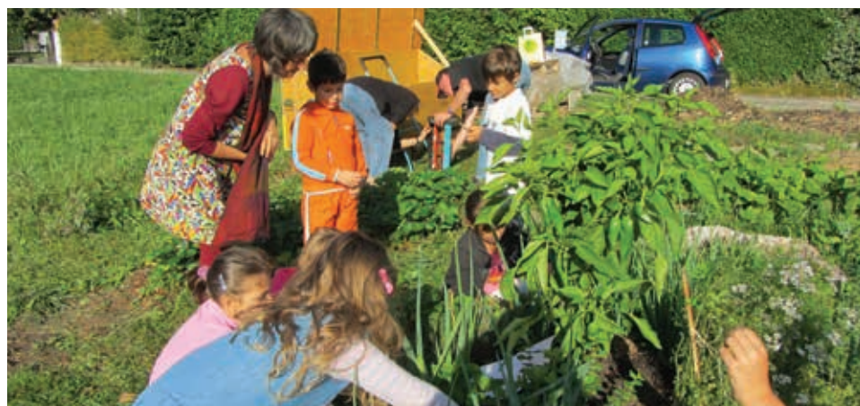
A Vogeardin, des enfants de l'école voisine participent à l'entretien du jardin

Qu'est-ce qu'Ecojardins Morges? Et quels sont vos principes directeurs?