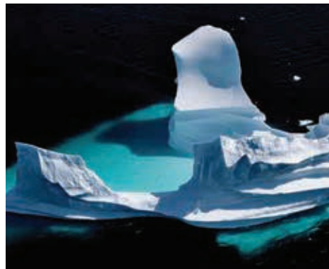
Iceberg érodé dérivant dans la mer du Labrador au large du Groenland

En décembre 2015 aura lieu la Conférence de Paris. A cette occasion, des représentants de pays du monde entier se réuniront pour signer le premier accord mondial pour une action commune contre le réchauffement climatique. Ce sera la plus importante déclaration de solidarité et de collaboration inter-gouvernementale de l'histoire.