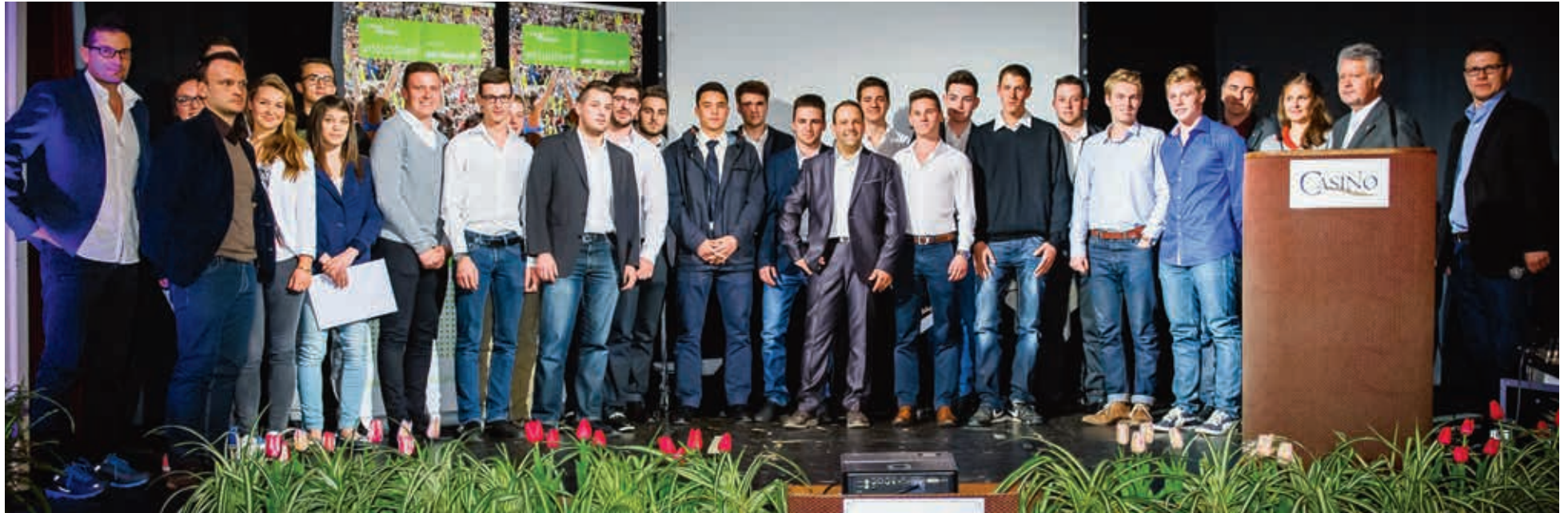
Les mérites sportifs 2013

La Ville de Morges compte de nombreux clubs sportifs, qui forment des centaines d'enfants et jeunes à leur discipline respective. Certains de ces sportifs, talentueux et assidus, réalisent des performances exceptionnelles. La cérémonie des Mérites sportifs et des bénévoles permet de les récompenser et de les mettre en valeur.