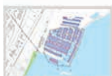
Ports de plaisance