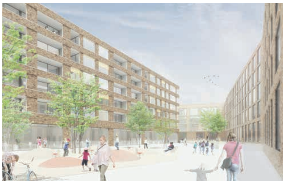
Le futur quartier Morges Gare-Sud

L'agglomération Lausanne-Morges, constituée en 2007 par une convention engageant la Confédération, le Canton, les Associations régionales et les Communes, œuvre pour faire face aux futurs défis liés à la mobilité, à l'augmentation du nombre d'habitants et à leur qualité de vie. L'agglomération compte 27 communes, 278'000 habitants (40 % de la population du Canton de Vaud) et 160'000 emplois (60 % des emplois du Canton).