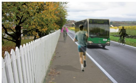
illustration de principe de l'aménagement de mobilité douce

La Direction générale de la mobilité et des routes de l'État de Vaud, en collaboration avec les Communes de Morges et d'Echichens, ainsi que les gestionnaires de réseaux souterrains, va entreprendre des travaux de réfection de chaussée, d'aménagement de mobilité douce, de remplacements de conduites et canalisations le long de l'avenue de Marcelin, de la route de St-Saphorin, ainsi qu'au carrefour du Signal.